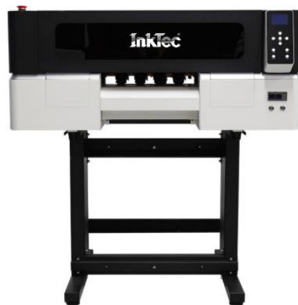
DTF INKTEC A300